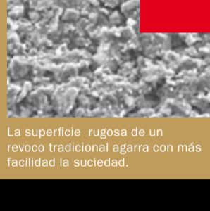
La superficie rugosa de un revoco tradicional agarra con más facilidad la suciedad.